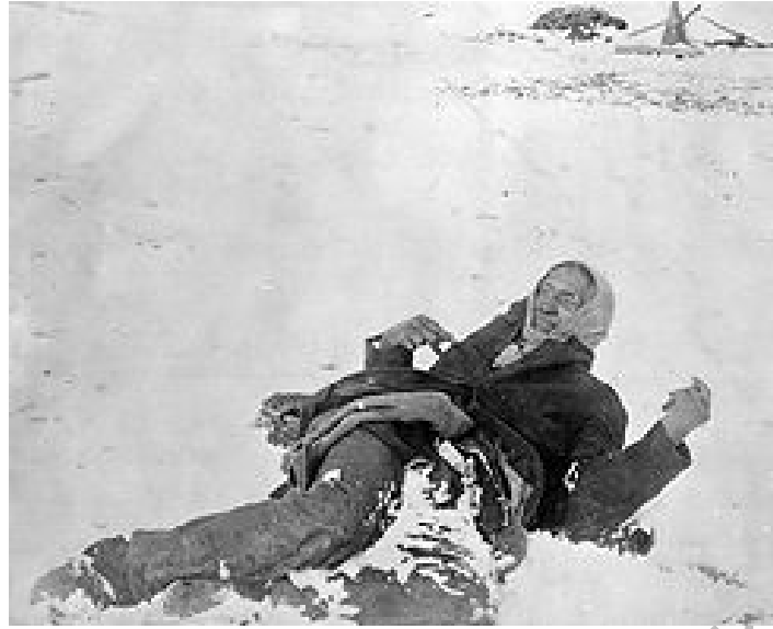
MASSACRO DI WOUNDED KNEE Eccidio di 144 Indiani Sioux 29 dicembre 1890: dopo rivolta degli indiani Cadavere del capo Big Foot nella neve