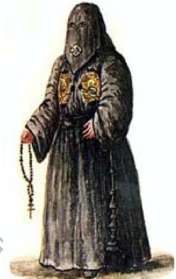
“UNTORI” della PESTE di MILANO del 1630 Raffigurati dalla fantasia popolare e dei pittori